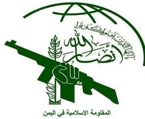
المقاومة الإسلامية فی الیمن

دستیار مدیر اداره ارشاد معنوی در نیروهای مسلح یمن با تاکید بر اینکه حساب کردن بر روی جداسازی جبهه‌های رویارویی، یک استراتژی مایوسانه صهیونیستی است، تاکید کرد که آنچه به عنوان وحدت جبهه‌ها شناخته می‌شود، دیگر صرفاً یک شعار سیاسی نیست، بلکه به یک واقعیت میدانی تبدیل شده است که از طریق هماهنگی مستمر بین طرف‌های محور مقاومت تجسم می‌یابد. هرکس روی شکستن اراده ما حساب کند، متوجه می‌شود که ما به یک کابوس استراتژیک تبدیل شده‌ایم که دشمن را در هر وجه از خاورمیانه تعقیب می‌کنیم. وی با اشاره به موضع بسیار ضعیف رسمی عربی در قبال جنگ در غزه، لبنان و ایران، انتقادات شدیدی را به برخی رژیم‌های عربی وارد و اعلام کرد که مواضع آنها نشان‌دهنده وابستگی به آمریکا است.