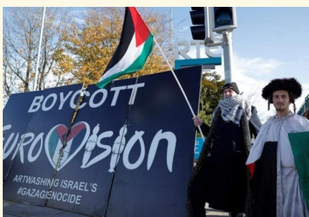
مسابقه موسیقی یوروویژن امسال در حالی برگزار می شود که حواشی سیاسی، بیش از همیشه بر آن سایه انداخته است. در روزهای اخیر، رسانه های اروپایی از فشارهای گسترده

یعنی تماشای زرق و برق سلبریتی ها در فرش قرمز جوایز مختلف سینمایی دیگر اهمیتی برای مخاطب غربی و شرقی نداشت و آن ها در حال پیدا کردن فضاهای جذاب تری برای سرگرم شدن بودند. پخش اینترنتی و تلویزیونی اسکار در سال ۲۰۲۶ با ۹ درصد کاهش نسبت به سال قبل روبه رو گردید و به ۱۷۰۸۶ میلیون نفر تنزل یافت. مخاطبان گلدن گلوب ۲۰۲۶ هم با ۸۰۶۶ میلیون بیننده از طریق شبکه CBS و پارامونت نسبت به سال قبل با کاهش ۷ درصدی مواجه شد و فقط جشن سزار در سال ۲۰۲۵ بود که توانست مخاطبانش را افزایش دهد. این در حالی است که کاربران شبکه های اجتماعی روز به روز در حال افزایش هستند و توجه به بلاگرهای مجازی بیشتر از بازیگران هالیوودی است.