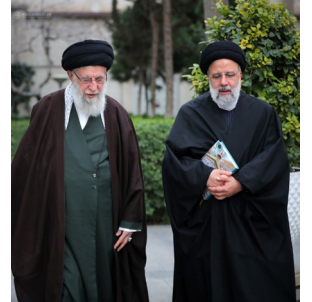
این شهدای عزیز تعیین شده است.